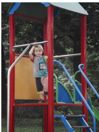
Fot. 16. Zdjęcie przedstawiające starszego syna Kubę na placu zabaw.