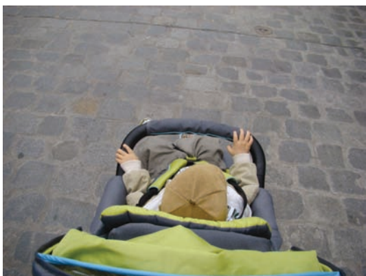
Fot. 19. Zdjęcie przedstawiające Kubę w wózku z perspektywy pchającej wózek kobiety.