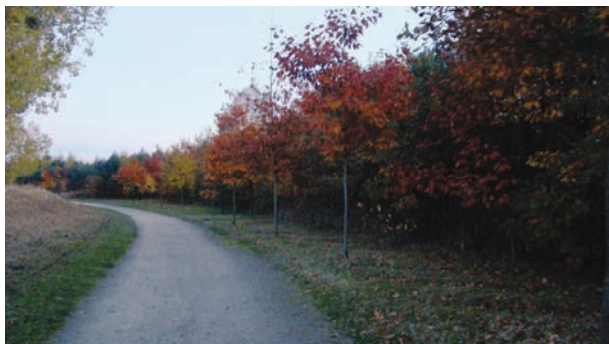
Fot. 32. Zdjęcie przedstawiające drogę. Fig. 32. A photo of a road.

Na zdjęciach wskazanych przez Agnieszkę, jako ilustracja jej macierzyństwa, droga przyjmuje postać zarówno asfaltowej ulicy, jak i leśnej ścieżki. Większość związanych z nią zdjęć została wykonana wczesną bądź późną jesienią, a tylko jedno zieloną porą roku. Jesień nasuwa skojarzenia pewnego schyłku, końca, ale także i przemiany.