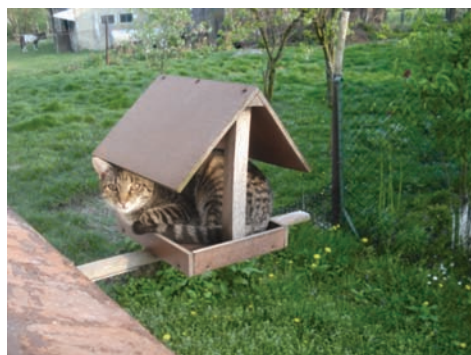
Fot. 26. Kot ukrywający się w ptasim karmniku.

Kategorią pośrednio związaną z dziećmi jest zbiór prezentujący twórczość synów, a dokładniej ujmując, starszego syna, gdyż młodszy w momencie przekazywania fotografii do badań jeszcze był za mały, by samodzielnie tworzyć. Odnajdujemy tu budowle z klocków, rysunki, nietypowo poukładane zabawki czy też dziwne konstrukcje, którym wyobraźnia dziecięca nadała sens. Spoglądając na zdjęcia ponownie odnosi się wrażenie, iż matka dokumentuje codzienne chwile, przeciwdziałając ich zapomnieniu. Każdy utrwalony przedmiot ma pewne znaczenie symboliczne: klocki wykorzystane do zbudowania garażu dla samochodów, niechybnie wskazują na męskie zainteresowania starszego syna, wyhodowana dynia jest ilustracją cierpliwości i wytrwałości chłopca, który poświęcił czas i energię na zasianie, i pielęgnację rośliny, dziwny „konstrukt” z opakowania po jajkach i kilku patyczków przenosi obserwatora w niesamowity świat dziecięcej imaginacji (por. Fot. 24). Matka kolekcjonuje te osiągnięcia, starannie zapamiętując etapy rozwoju dzieci, czyniąc z fotografii pamiątki przywodzące na myśl dumę, jaką odczuwała, kiedy dziecko zaprezentowało jej swoje osiągnięcie.