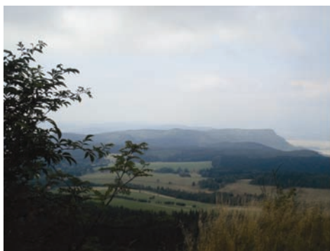
Fot. 33. Zdjęcie przedstawiające góry. Fig. 33. A photo of some mountains.

Kilka zdjęć w kategorii „miejsca” przedstawia góry, skadrowane w specyficzny sposób: kadr każdej fotografii z jednej strony zamyka gałąź pobliskiego krzaka czy drzewa. Sprawia to wrażenie, jakby ktoś podglądał góry z ukrycia, zerkał na nie z tęsknotą, jak na coś odległego, niedoścignionego, ale pięknego i pożądanego. Zdjęcia te