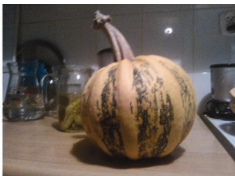
Fot. 25. Fotografia przedstawia dynię wyhodowaną przez starszego syna – Kubę.

Fig. 24. A photo presenting a toy that the elder son, Kuba, made himself.