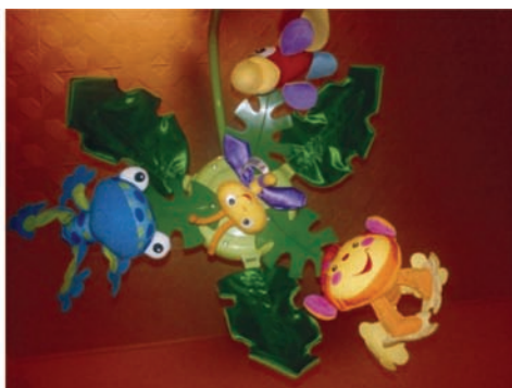
Fot. 37. Fotografia ilustrująca macierzyństwo, wybrana przez Agnieszkę.

Fig. 36. A photo of a rainbow in a city.