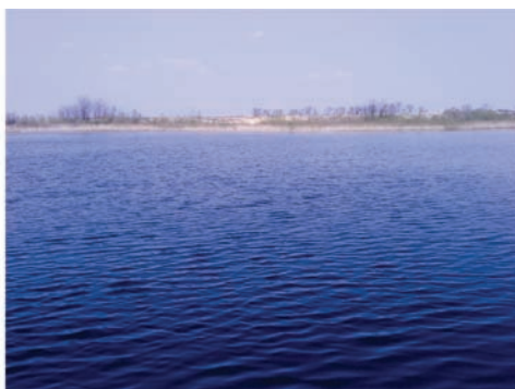
Fot. 34. Zdjęcie przedstawiające wodę. Fig. 34. A photo of water.

kojarzą mi się z samotnością, ze świadomością, że w oddali jest coś pięknego, potężnego, ale także z nieśmiałą wiarą, że dla fotografa ten odległy cel być może jest osiągalny.