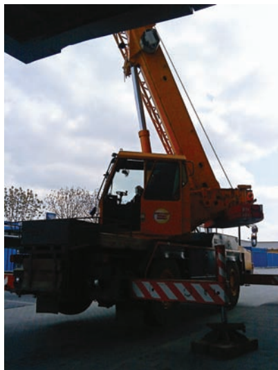
Fot. 31. Zdjęcie dźwigu budowlanego.