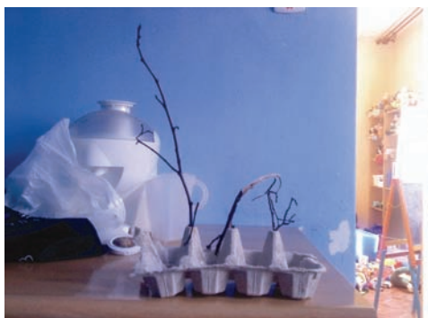
Fot. 24. Zdjęcie przedstawia samodzielnie skonstruowaną przez starszego syna Kubę zabawkę.

W macierzyństwie Agnieszki pojawia się też kategoria „inne dzieci” 17 , która zawiera zdjęcia wykonane z podobnej perspektywy, co jej własne potomstwo: zdjęcia pozowane, fotografowane maluchy spoglądają bezpośrednio w obiektyw, wypełniają sobą niemal cały kadr. Dzieci przedstawione na zdjęciach są rozradowane, zabawne lub przybierają niecodzienne miny. Nie jest to tym razem rejestracja codzienności, lecz wskazanie na pewną nietypowość, wyjątkowość. Fotografowane podmioty należą do rodziny Agnieszki. Można przypuszczać, iż matka włączyła je do zbioru fotografii ilustrujących swoje macierzyństwo z uwagi na bliskie relacje z dziećmi – zarówno swoje, jak i swoich synów – oraz właśnie ze względu na przedstawienie pewnych wzorcowych, zawsze pozytywnych, sytuacji.