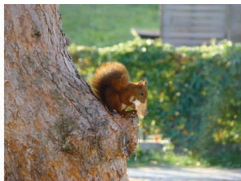
Fot. 27. Wiewiórka jedząca pieczywo.