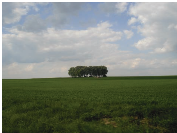
Fot. 35. Fotografia ukazująca kępę drzew na rozległym polu.

Fig. 35. A photo of a grove in a big field.