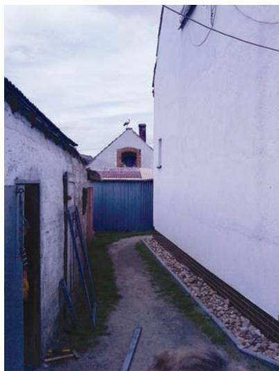
Fot. 30. Zdjęcie przedstawiające dom, w którym mieszka Agnieszka.