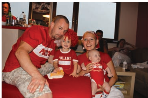
Fot. 3. Rodzina Karoliny w trakcie kibicowania polskiej drużynie piłkarskiej podczas Euro 2012.

wędrowkę w niskiej temperaturze. Na tej podstawie można stwierdzić, iż rodzina ta przede wszystkim jest nastawiona na aktywne spędzanie czasu, a niejako przy okazji chce również powiedzieć o tym świecie poprzez wystylizowaną prezentację na fotografiach. Ponadto wszystkie prezentowane zdjęcia mają pozytywny nastrój, niemal każda z przedstawionych osób uśmiecha się lub ma zadowolony wyraz twarzy, nie dostrzegamy znudzenia, smutków, zmartwienia. Sprawiają one wrażenie, iż wszyscy są szczęśliwi i naprawdę dobrze się bawią.