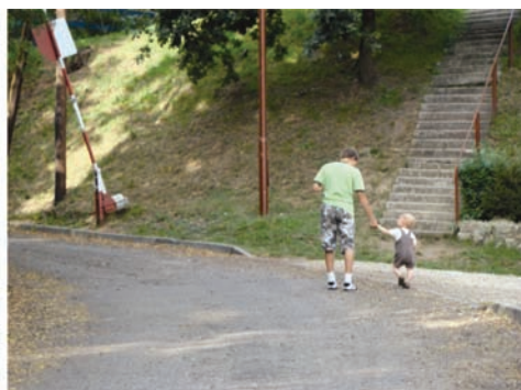
Fot. 23. Kuba z kuzynem; na zdjęciu wyraźna niedbałość kadru.