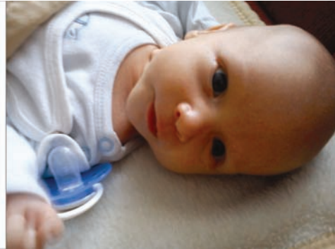
Fot. 14. Fotografia przedstawiająca młodszego syna Borysa uważnie spoglądającego na fotografa.

Fig. 13. A photo presenting Kuba, the elder son, during one of his first meals.