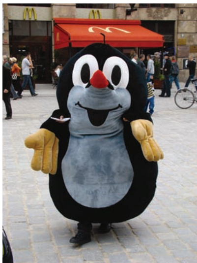
Fot. 28. „Krecik” na wrocławskim rynku. Fig. 28. „Krecik” on the market square in Wrocław.

setny raz na pytanie „A co to jest?” „Rybka”... Zdjęcia te mają za zadanie przywoływać wspomnienia, ich pogodny wymiar sugeruje, iż były to dobre chwile związane z macierzyństwem Agnieszki.